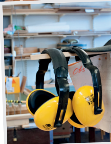
Full fart på bygget.

verka och mervärdet för de äldre är stort.