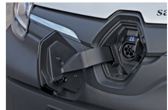
Bilen tankas med el genom luckan i huven.

Saknas det klassiska bil-ljudet i den väldigt tystgående elbilen, kan det enkelt lösas. Hur då, kanske du undrar? Jo, genom att välja tillbehöret "konstgjort motorljud". Fantastiskt! 🌱