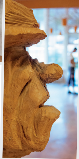
Den snidade träfiguren är gjord av konstnären Assa Blidmo, Heby.

Bygget på Kaplanen planeras att vara färdigställt under våren 2015. 🗨️